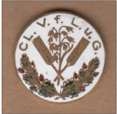
Anstecknadel des Cladower Vereins für Landschafts- und Gartengestaltung