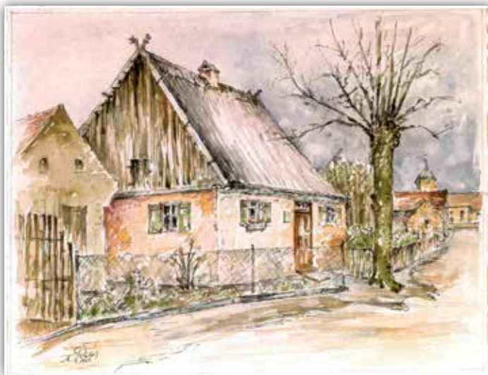
Ältestes Haus in Kladow, Kossätenhaus von 1813, Zeichnung von Erwin Rettig

Groß-Glienicke hat sich den dörflichen Charakter noch mehr bewahrt als Cladow. Hier finden wir noch ausschließlich das alte märkische Bauernhaus, wo Stall und Wohnung ineinander läuft, wo das Rohrdach tief über die kleinen Fenster hängt und der Pferdekopf am Giebel vom Kult der Ahnen erzählt. Ein schlichter Dorfkrug ladet zur Rast. Am Glienicker See entlang, der sich ziemlich weit hinzieht, und an der Zie-