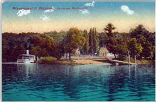
Ansichtskarte von 1918 Überfahrt zur Pfaueninsel

dorfes. Ist man die holprigen Straßen emporgestiegen, so genießt man einen Ausblick, der seinesgleichen sucht. Der Wannensee, hier in seiner Vereinigung mit der Havel mehr ein Haff als ein See, liegt in seiner ganzen Breite zu unseren Füßen, rechts und links hin aber dehnt sich der Fluß, bald breit dahinschießend, bald durchsetzt von Inseln und Werdern, abgegrenzt von den dunklen Höhen der Grunewaldberge und