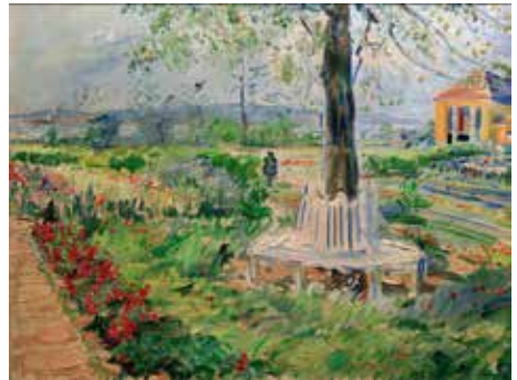
Abb. 5: Slevogt, Garten in Neukladow (1912)