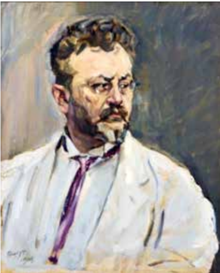
Abb.2: Slevogt, Selbstbildnis (1915)