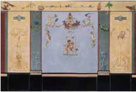
Abb. 4: Die Rückwand des Pavillons