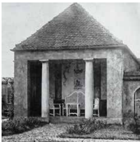
Abb. 3: Blick auf den Gartenpavillon (1912)

Eine relativ unscheinbare ca. 6 m breite und ca. 2 m tiefe Gartenhalle, die gerade geräumig genug war, um eine Zweisitz- er-Bank, einen kleinen Tisch und zwei Stühle hineinzustellen (s. Abb.3), wurde also zu einem Kunstobjekt umgestaltet. Obwohl die Bildelemente der Rückwand und der Decke spielerisch-leicht annu-